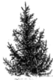
Épinette de Norvège