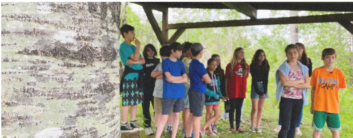
Inauguration du projet « Parcelle de Forêt pédagogique » à Girardville en juin 2023

Comprenant 12 objectifs généraux, 19 objectifs spécifiques, 12 actions à valoriser et 30 à développer, le cœur de ce plan d'action vise à ce que les Saguenéens, les Jeannois et les Montagnais du Lac Saint-Jean comprennent les enjeux du milieu forestier ainsi que son importance économique, sociale, environnementale et culturelle dans une perspective de développement durable.