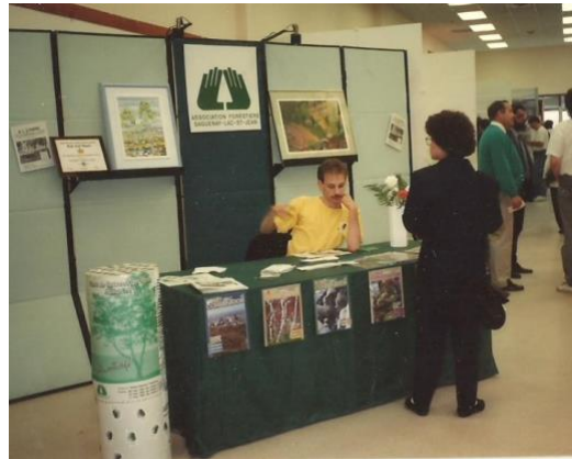
Kiosques informatifs de l'Association forestière pour la Semaine des arbres