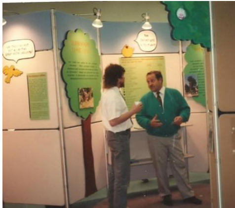
Kiosques informatifs au salon de la Semaine des arbres