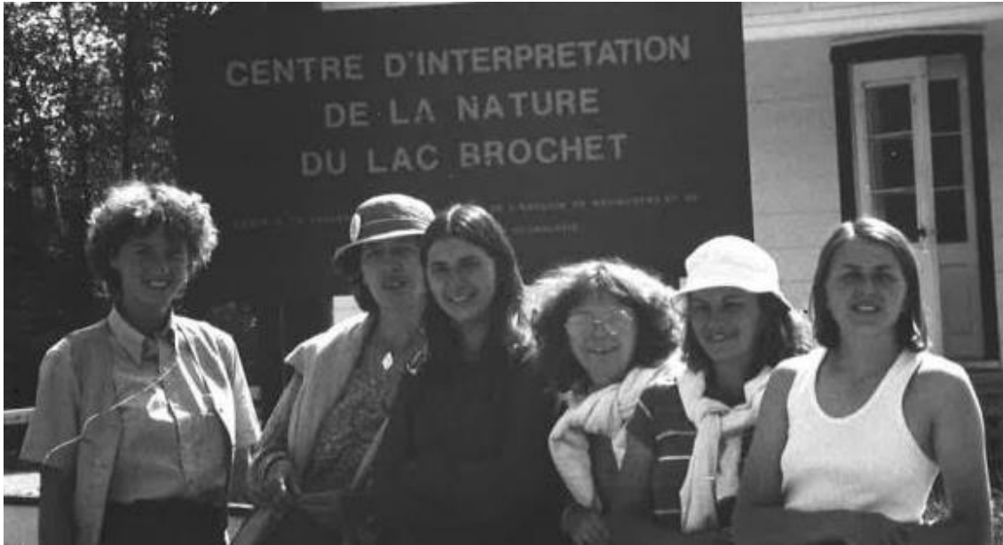
Centre d'interprétation de la nature du Lac Nature du Lac Brochet

Les Associations régionales préparent leur congrès annuellement, sous un thème général. À partir de 1975, notre Association régionale élabore elle-même le contenu de ses assises, cet événement devient ainsi plus vivant et plus instructif.