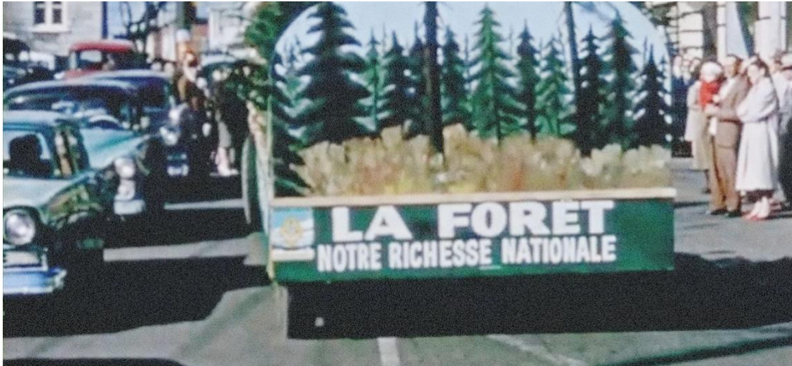
Les opérations Conservations Protections, années 60

Au début des années 1960, l'opération C.P. (conservation et protection) voit le jour. L'Association présente des parades, offre des journées agroforestières, invite la population à des soirées canadiennes et à des démonstrations dans les chantiers avec, comme vedette, l'ours « Smokey ».