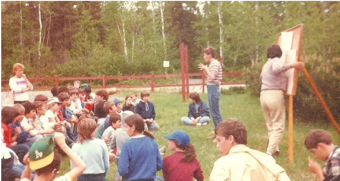
Centre d'interprétation de la nature du Lac Nature du Lac Brochet

Programmes éducatifs et autres interventions touchent annuellement plusieurs milliers de personnes.